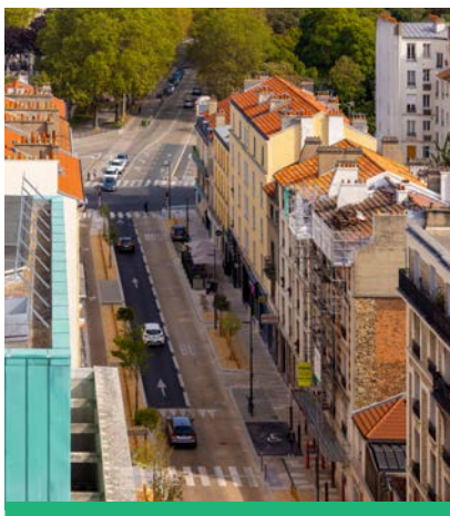
L'avenue de la République - Nord favorise les mobilités douces depuis son réaménagement à l'été 2023.

- Livraison de l'avenue de la République - Nord (été 2023) - Montant des travaux : 1,5 million d'euros.