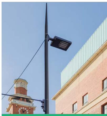
Le nouvel éclairage LED avenue de la République (Nord) permet des économies d'énergie.