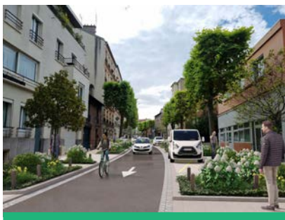
La nouvelle avenue de Verdun rénovée sera plus apaisée.