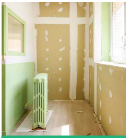
Les travaux de la 1 ère future école vertueuse de la ville (le groupe scolaire Rabelais) ont commencé en 2023 notamment avec l'isolation des murs.