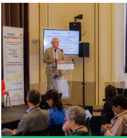
Le Maire a organisé une journée d'inspiration « Plus fraîche ma ville » avec France Ville Durable en présence de tous les acteurs locaux.

- Nouvelle édition du festival Inspirations Végétales (juin 2023) pour rassembler les Franciliens autour des thèmes de la végétalisation et du rafraîchissement de la ville. Au programme de ces deux jours, des ateliers, des conférences, un marché et des animations sont organisés gratuitement pour permettre aux participants de découvrir l'agriculture urbaine et la biodiversité, et comprendre comment chacun peut verdir la ville à son échelle.