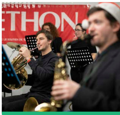
Le Téléthon 2022 à Montrouge a permis de recueillir 30 300 € en faveur de l'AFM.