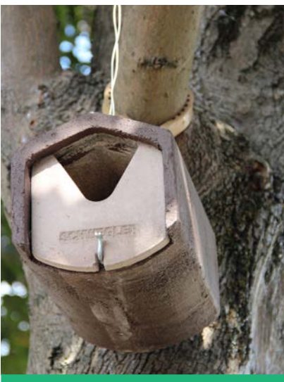
De nouveaux nichoirs ont été installés à Montrouge.