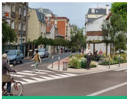
Le jardin d'angle Molière/Verdun va être réaménagé et végétalisé pour être ouvert sur l'espace public.