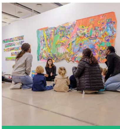
Les enfants des crèches visitent aussi le Salon de Montrouge.