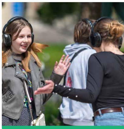
Le Spectacle Happy Manif a été apprécié par les enfants des écoles de la ville.