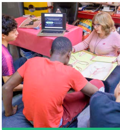
Des actions de prévention sont menées toute l'année au Centre municipal de santé.