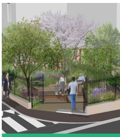
Le jardin Descartes offrira un nouvel espace vert ouvert aux habitants du quartier.