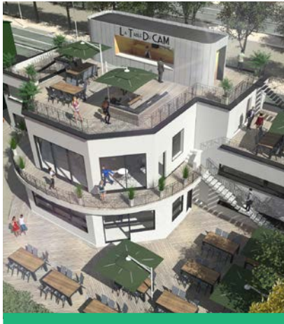
Vue du futur restaurant du Cercle Athlétique de Montrouge