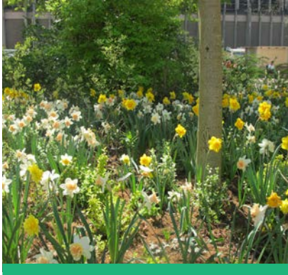
Le plan fleurissement durable se poursuit avec la plantation de bulbes.