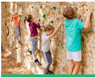
La nouvelle via ferrata au Square de l'avenue de la République a été réalisée dans le cadre des budgets participatifs montrougiens.