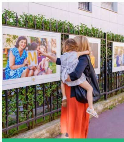
L'exposition sur le thème de l'intergénérationnel lors de la Semaine bleue a été une première en octobre 2023.