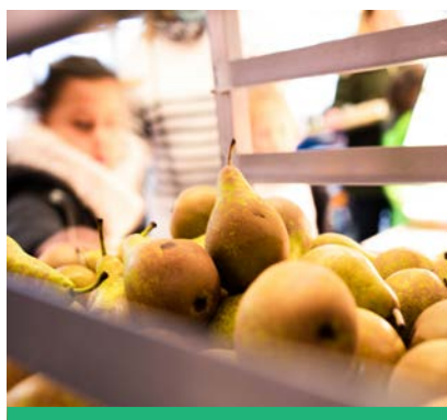
Le Bien manger dans les cantines scolaires.