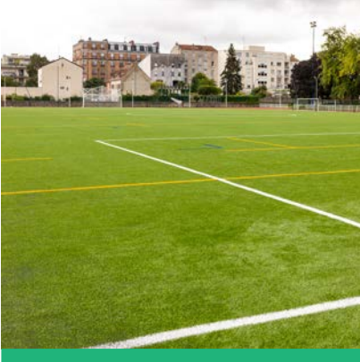
Les joueurs de foot, rugby et frisbee profitent de la pelouse rénovée du stade Maurice Arnoux.