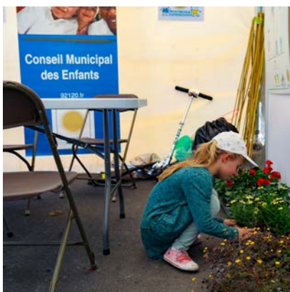
Le Conseil municipal des enfants sur son stand à Inspirations végétales (juin 2023) est très actif.