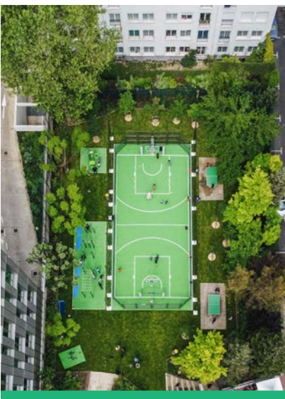
Des équipements de street workout et un tout nouveau terrain multi-sports sont désormais accessibles à tous au square de Marne.