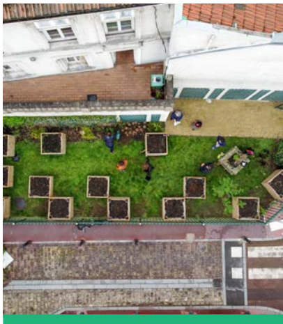
Le jardin partagé Villa Leblanc est le 9 e à Montrouge.