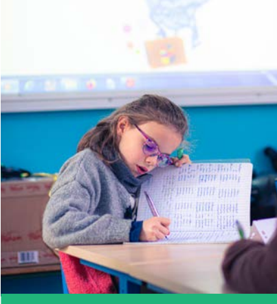
Des ateliers sur la santé du cerveau ont été organisés dans 65 classes.