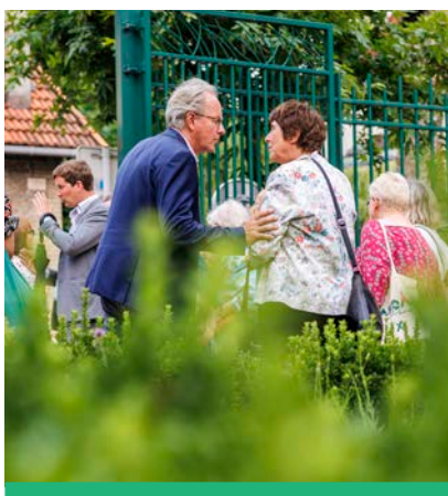
Le Maire propose une balade urbaine dans chaque quartier pour rencontrer les habitants.