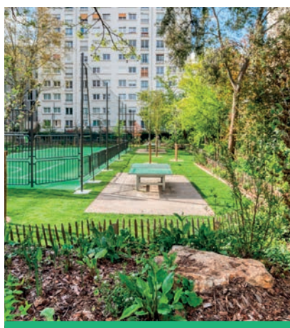
Le Square de la Marne a été entièrement rénové et végétalisé en 2023