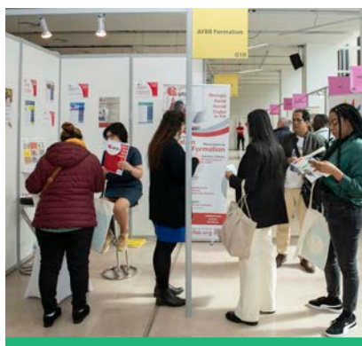
Le salon Décl'ic'Emploi au Beffroi en mai 2023 a réuni 1 200 visiteurs.