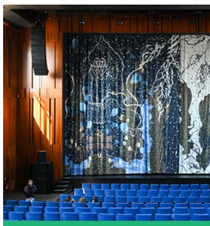
Le nouveau rideau de scène monumental du Beffroi s'est dévoilé aux Montrougiens en avril 2023.