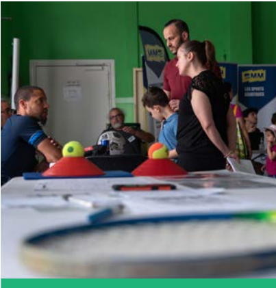
Le forum des sports de juin 2023 permet de s'inscrire.