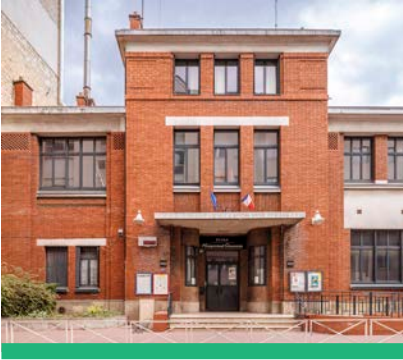
L'école Raymond Queneau poursuit son vaste programme de rénovation énergétique.