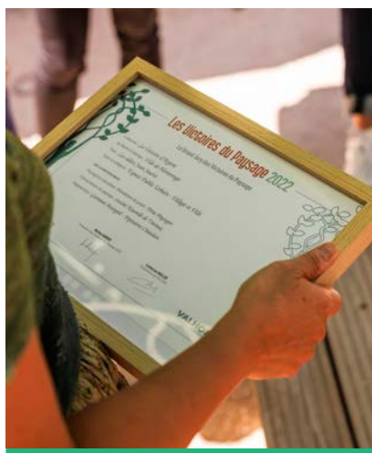
Montrouge a été labellisée Victoire du Paysage 2022 pour les Allées Jean Jaurès.