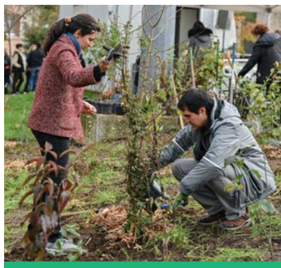
La plantation participative de la mini-forêt urbaine au stade Jean Lezer a été un succès.

- Intégration et renforcement de la présence de nature et de biodiversité dans tous les projets de requalification de rues et de quartier avec un objectif de 10 % de la surface totale minimum.