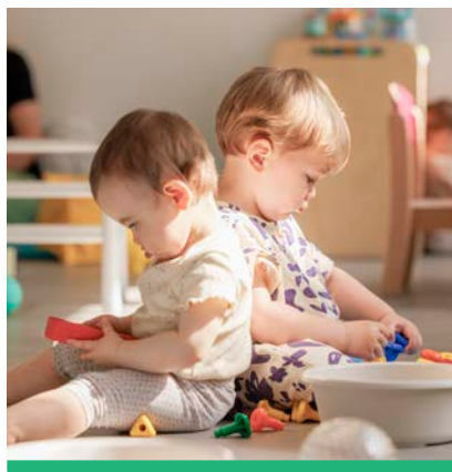
La Maison des Tout-Petits, 4, rue Barthélémy, a ouvert en septembre 2022. Un succès !