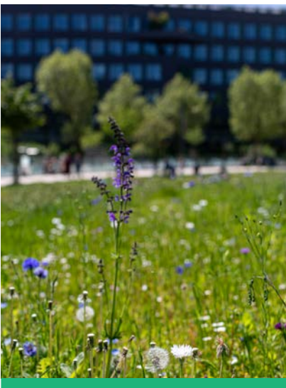
La prairie fleurie du Parc Jean-Loup Metton égaye le passage des visiteurs.