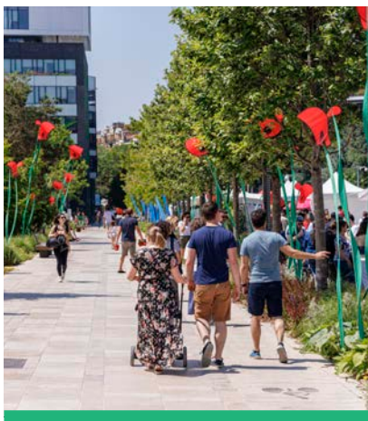
Le festival Inspirations Végétales accueille chaque année près de 15 000 visiteurs.