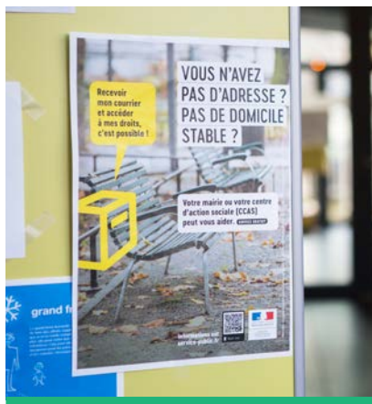
Le Centre communal d'action sociale propose la domiciliation.