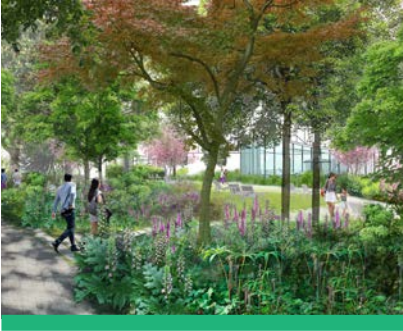
131 arbres seront plantés dans le cadre du projet Schuman et ses alentours.