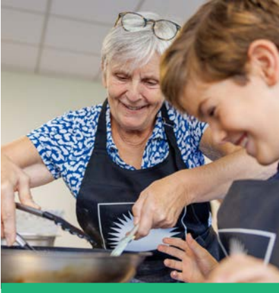
Des ateliers cuisine intergénérationnels ont été organisés par le nouveau service municipal du Bien vieillir.