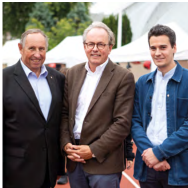
Étienne Lengereau , Maire de Montrouge Président de Vallée Sud - Grand Paris (au centre)