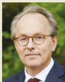
> Étienne Lengereau , Maire de Montrouge