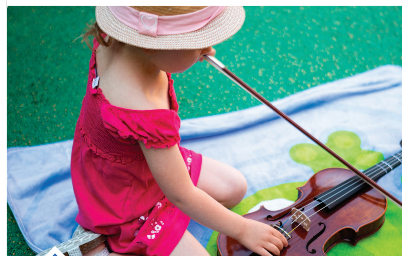
Manipuler des matières, des matériaux et même des instruments de musique : du pur bonheur !

■ Notre jardin d'enfants met en place un cadre souple où l'on apprend à faire attention à soi et aux autres, adultes comme camarades. Tout est proposé sans obligation, car ici priment les notions de jeu et de plaisir.