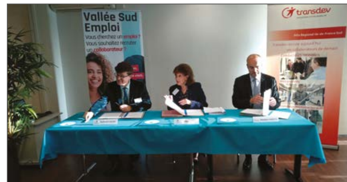
Signature de la Charte emploi et apprentissage entre la société de mobilité urbaine Transdev, le GIP Vallée Sud Emploi et l'EPT Vallée Sud Grand Paris le 10 octobre 2019

En lien avec des organismes partenaires tels que le GRETA ou l'AFPA, des ateliers ou le Pass'Apprentissage, les conseillers emploi-formation accompagnent le jeune pour lui permettre d'acquérir les compétences indispensables pour réaliser son projet professionnel.