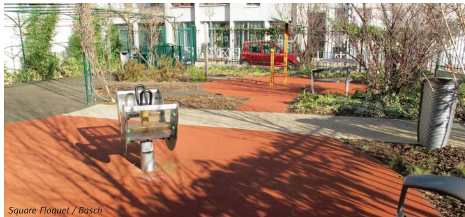
Square Floquet / Basch

La récente autorisation de démolition d'un bien immobilier au 126 avenue Henri Ginoux va permettre la création du 5 e jardin d'angle de Montrouge. L'occasion de revenir sur ces parcelles de verdure qui embellissent notre ville.