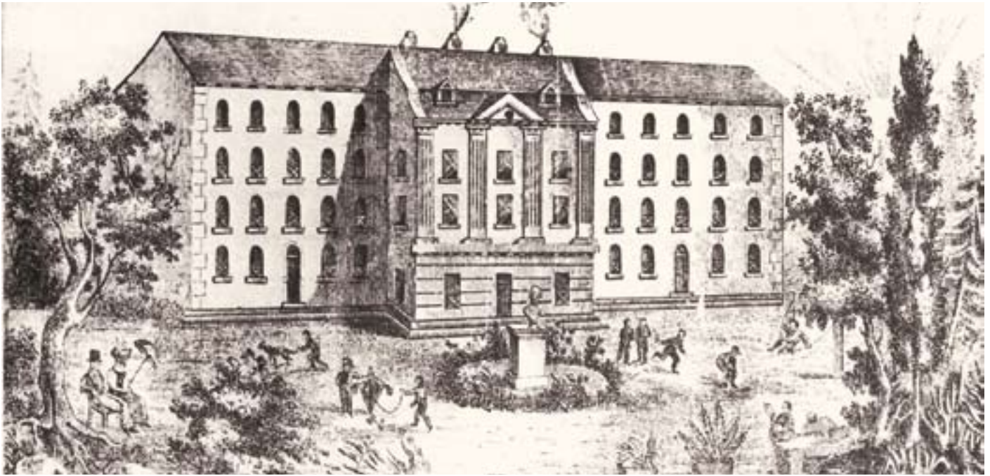
« La Pension Joliclerc sur l'avenue de la République, vue des jardins »

La fin du XIX e siècle marque un tournant décisif au sort de Montrouge comme le prouve l'article 663 du Code Civil daté du 28 juin 1894 : « La commune de Montrouge en raison notamment de son importance et des établissements publics qu'elle renferme, doit être classée dans la catégorie des villes. » Prés, marais et terres cultivées disparaissent, mais non plus en faveur de vastes pavillons cossus protégés de grilles ouvragées et de hauts murs derrière lesquels s'abritaient quelques fonctionnaires retraités accompagnés des deux ou trois domestiques qui leur restaient. Les grands espaces, dépouilles des jardins et potagers des demeures aristocratiques, se morcellent, comme la propriété Joliclerc *, ancien domaine du duc de la Vallière transformé en collège Saint-Joseph, ou encore le quartier du Parc gagné en compensation de la perte du «Petit Montrouge» englobé dans le Paris de 1860 et dont les rues couvrent progressivement de leurs pavés de bois les anciennes allées du parc seigneurial, affublées de noms d'écrivains tirés au hasard de manuels scolaires et où s'élève en l'occurrence le «groupe du Parc» **, toujours debout et en partie transformé en «Conservatoire Raoul Pugno» depuis peu, alors modèle du genre au grand dam des édiles de Cachan. Jules Ferry n'a pas encore sa place, mais il règne au ministère de l'Instruction Publique (l'Éducation