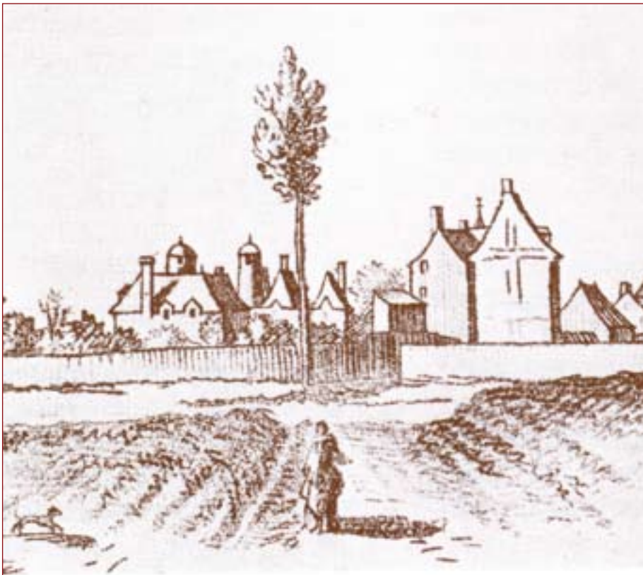
Montrouge vu de la route d'Orléans au XVII e avec les toitures élaborées du château à l'arrière-plan. Le coq du clocher dépasse les maisons (marquées d'une croix, appartenant aux Guillemites). Les murs longent l'actuelle avenue Henri Ginoux. L'orme est bien haut mais trop frêle pour avoir été planté en 1553 : il ne serait pas le premier.

moi sous l'orme » s'utilisait jadis pour un rendez-vous auquel on n'avait nul dessein de se rendre. Le lien logique avec le fonctionnement de la justice locale n'est pas précisé ; fut-ce parce que le parti fautif ne se présentait que rarement par crainte d'une application immédiate de la sentence, ou, au contraire, pour moquer la lenteur avec laquelle la justice s'y rendait. Au Moyen Âge, on s'y rassemblait en mai pour tenir des « plaids de courtoisie et de gentillesse » et se livrer aux « jeux sous l'orme », c'est-à-dire qu'on y dansait, on y chantait et on organisait des concours de poésie. La population totale du Montrouge d'alors n'y suffisait pas et, si cela était, il fallait appeler à la rescousse les fêtards des villages voisins : Vanves, Arcueil, Bagneux ou Gentilly dont on disait que les filles « étaient faciles ». Les littérateurs de l'époque, comme Rabelais, nous apportent la preuve de ces nombreuses réjouissances champêtres, « rave parties » d'un autre temps mais sans doute de mœurs semblables.