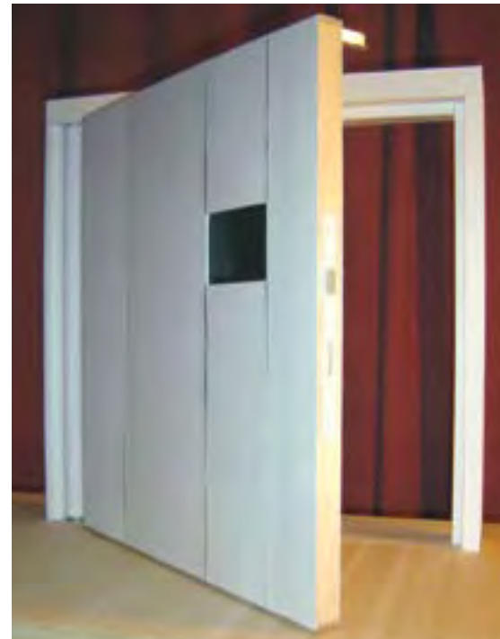
Maquette de la partie haute de la porte

Le procédé est adaptable à différentes tailles de portes. Son design est innovant et esthétique. La porte est sur un axe unique, et permet une ouverture jusqu'à 160°. Un loquet placé sur le haut de la porte se déploie automatiquement dès l'ouverture de la porte. Ainsi, il empêche la fermeture accidentelle de la porte. Seule la manipulation de la poignée débloque ce loquet et permet la fermeture. Cette poignée est bien sûr inaccessible aux enfants.