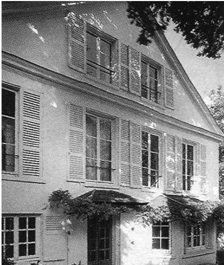
Le pavillon de Pierre et Marie Curie

Nous poursuivons nos éclaircissements sur la vie du couple Curie, sur la personnalité de Pierre et le fait qu'une rue de Montrouge ne porte que le nom de ce dernier.