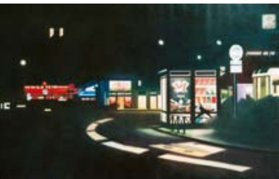
Anastasia BORDEAU : « A côté de Montparnasse » - huile sur toile

La section Découvertes perpétue la tradition du Salon de Montrouge de contribuer à faire connaître de jeunes artistes. Elle est fidèle à sa mission : être le tremplin de la jeune création. Pour cette 52 e édition, près de 160 jeunes artistes (entre 20 et 40 ans), pour la plupart issus des écoles des Beaux-Arts, vont ainsi présenter leur travail. Ces artistes doivent vivre et