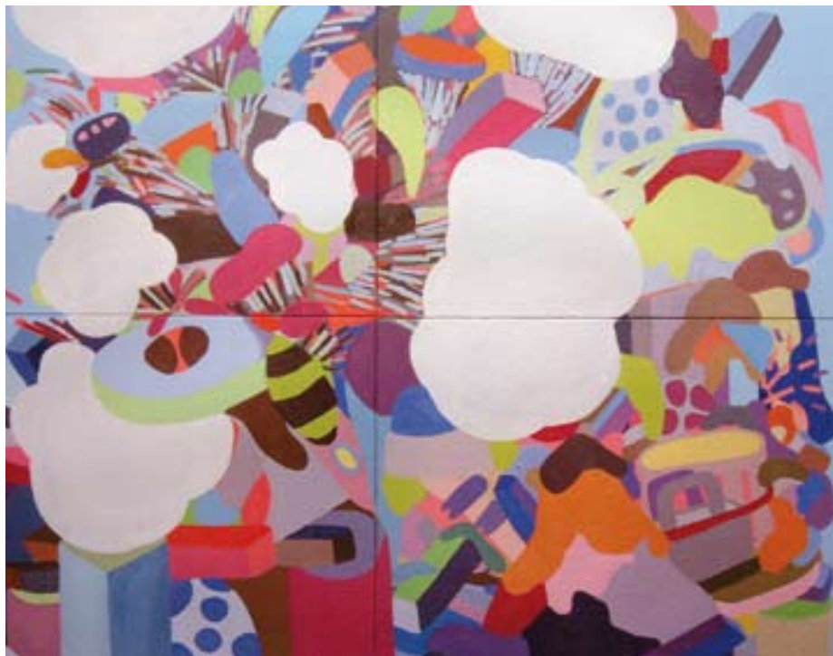
Camille CLOUTIER : « Exil » - Huile sur toile

Avec ce panorama des nouvelles tendances artistiques contemporaines, cette réflexion sur les rapports entre design et art, ses conférences découverte, ainsi que la Journée interdite aux parents, le 52 e Salon d'Art Contemporain de Montrouge reflète l'attachement aux valeurs culturelles de la Ville.