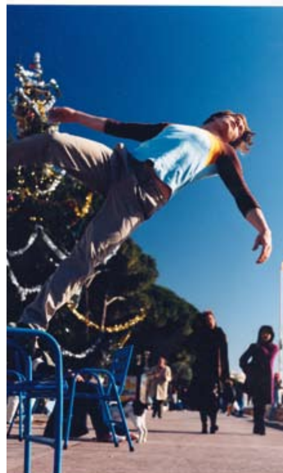
Christian LARTILLOT : «croisette-cannes» - photographie