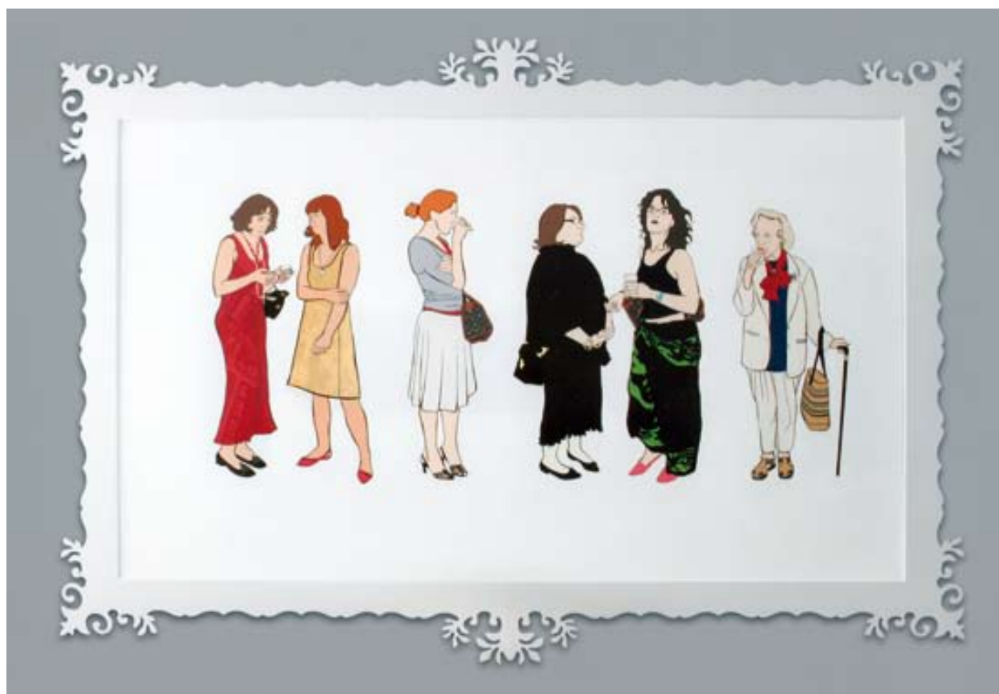
Tommaso NICOLAIO « 2nd street opening » - Acrylique sur toile et cadre plexiglass

La 52 e édition du Salon d'Art Contemporain ouvre ses portes du 26 avril au 20 mai au Théâtre de Montrouge. Le salon poursuit sa mission en présentant un panorama des nouvelles tendances artistiques contemporaines dans sa section « Découvertes 2007 ». Cette année, la deuxième section présentera les œuvres d'artistes qui se sont prêtés à un exercice sur le thème du design.