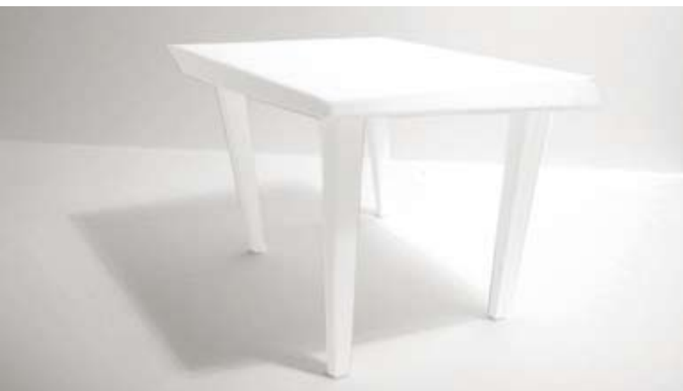
Aline DEFERT : « Un léger trouble » - table