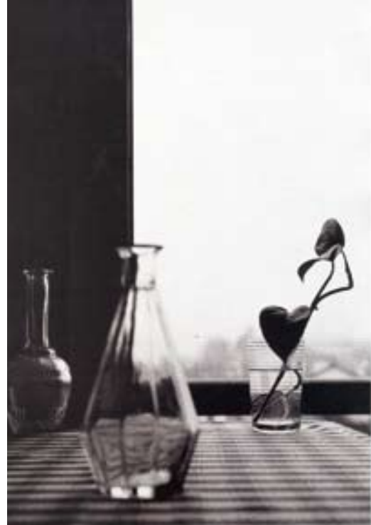
Frédéric SUEUR : «Nature Morte» - photographie

sélection. Mais l'ensemble s'inscrit dans un univers plutôt serein, coloré et gai, avec de nombreuses références à la mémoire.