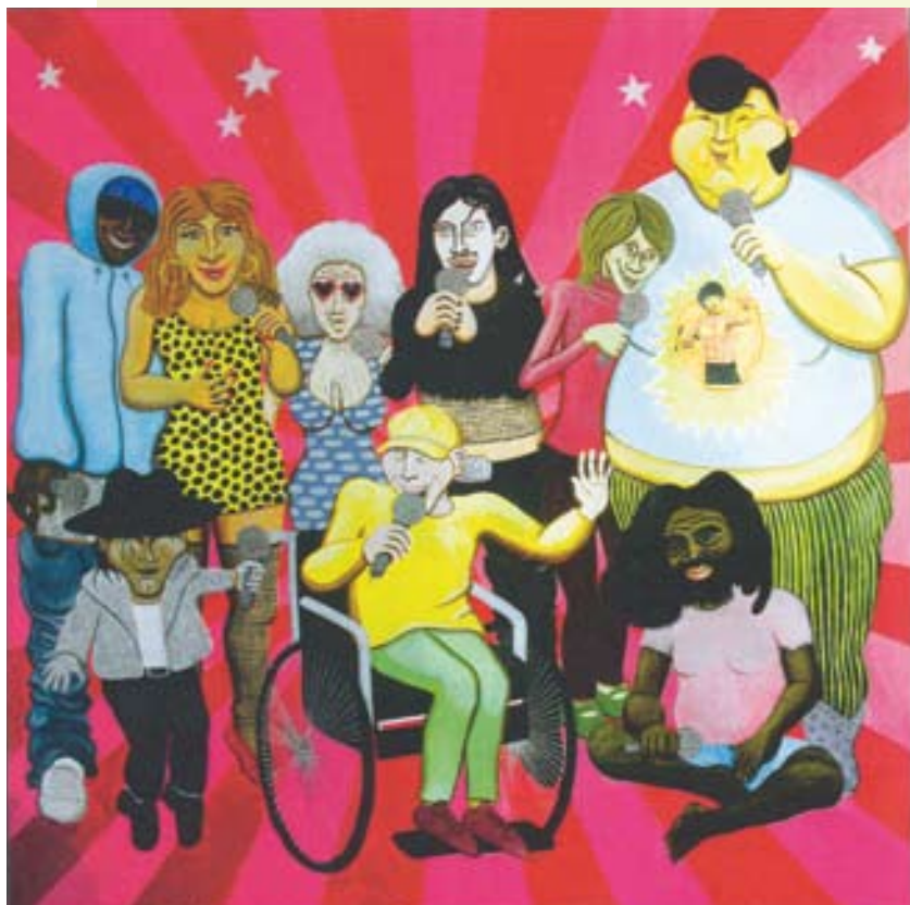
Nicolas MOREAU : «casting de starac» - huile sur toile

Quatre prix décernés par un jury constitué de critiques d'art et d'artistes viendront encourager les travaux de ces créateurs appelés à jouer un rôle de premier plan dans l'univers artistique international.