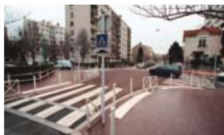
Voirie refaite Henri-Barbusse

La dernière phase de réfection du passage Jean-Moulin a été effectuée en février côté rue de la Vanne. La réfection de la chaussée et des trottoirs de la rue Barbusse entre la rue Arthur-Auger et l'avenue Jean-Jaurès a été effectuée durant l'hiver. Devant