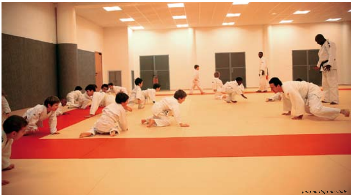
Judo au dojo du stade

Les permis de construire des deux jardins d'éveil d'une capacité de 30 enfants chacun (au 12, rue de la Vanne et au 7, rue du 11-Novembre) ont été déposés en février : les travaux devraient démarrer au cours du 3 e trimestre 2007.