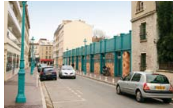
Voirie rue Victor-Hugo

les nouveaux ateliers municipaux, la voirie de la rue Paul-Bert a été revue complètement.