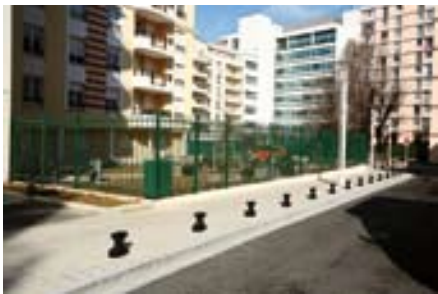
Voirie refaite rue Danton

La voirie de l'avenue de la Marne, entre la rue Germain-Dardan et l'avenue Verdier, est en pleine transformation : le chantier est programmé sur environ cinq mois puisqu'il ne concerne pas moins que la réfection de la chaussée, des trottoirs, du stationnement, des candélabres. Une piste cyclable à double sens sera créée du côté du marché et de la poste.