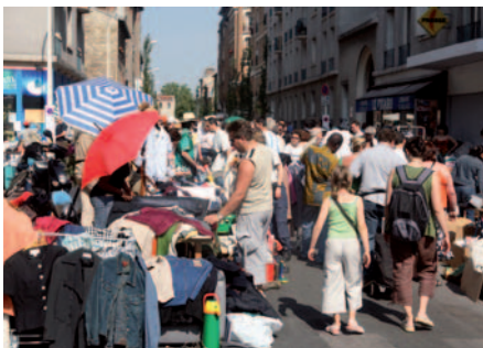
Il y a toujours quelque chose à dénicher aux puces du Village Jean Jaurès ! Cette manifestation attire chaque année, exposants, chineurs, habitués et promeneurs du dimanche.

Place Emile Cresp et dans les rues alentours Par l'association "Portes de Montrouge". Tél. 06 73 06 83 10. ■