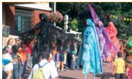
La grande cavalcade a suscité l'enthousiasme des Montrougiens.

aubades et au défilé géant avenue de la République de fanfares, danseuses et attractions en tous genres. Un concentré de succès pour célébrer le travail ingrat de ceux qui, il n'y a pas si longtemps, extrayaient à l'aide d'outils parfois rudimentaires, cette pierre qui fit la beauté de nos bâtiments...parisiens !