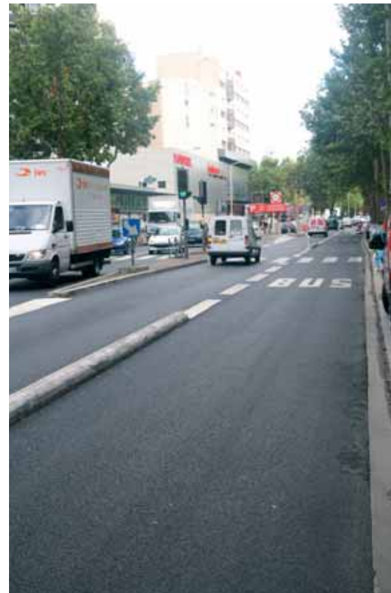
Chaussée av Pierre Brossolette

Des travaux de reprise d'étanchéité de la crypte du cimetière sont en cours. Les bornes rue Fénelon seront prochainement "mises en route". Des panneaux directionnels indiquant