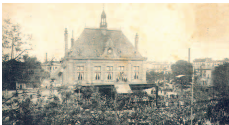
(2) La Mairie dans son premier état, au centre de la grande place de la République ici couverte de monde à l'occasion du concours de pompes le 1er juin 1902.

Patrick Vauzelle, Société historique et archéologique du Grand Montrouge.