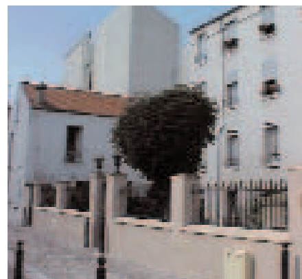
Réseaux souterrains (après travaux)