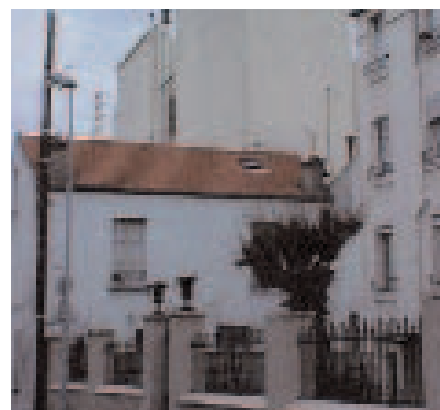
Réseaux aériens (avant travaux)

EDF-gaz de France a enterré les réseaux de distribution, Villa Leblanc pour le plus grand plaisir des riverains