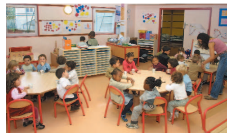
Rentrée 2004 à la maternelle Maurice Arnoux

Depuis quelques années maintenant, de grands projets ont vu le jour. C'est tout d'abord la création de nouvelles structures pour les enfants qui se sont ouvertes. Cinq jardins d'enfants se sont ouverts en deux ans et demi. Devant