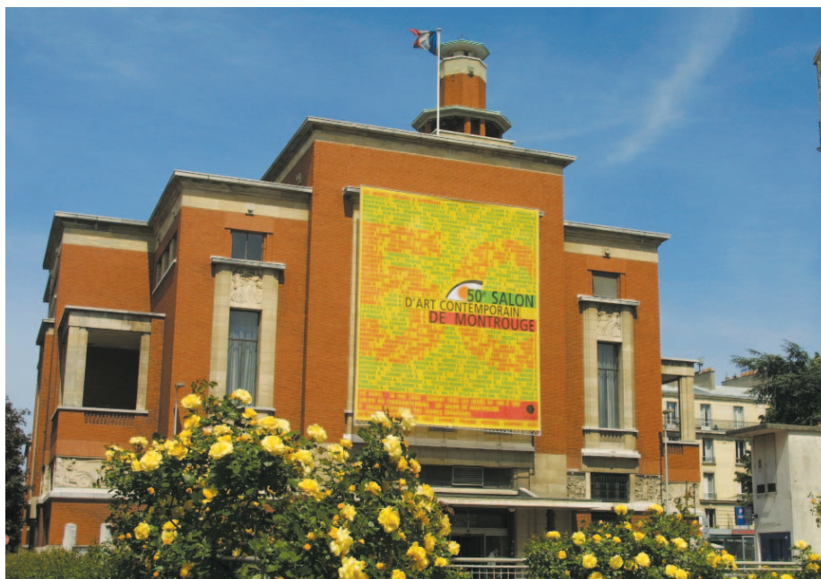
"Pouvoir offrir à la Culture la place qu'elle mérite à Montrouge"

Plus d'espace, plus de modularité, le cloisonnement intérieur sera totalement réétudié - Projet : Coupe du Centre culturel et de Congrès