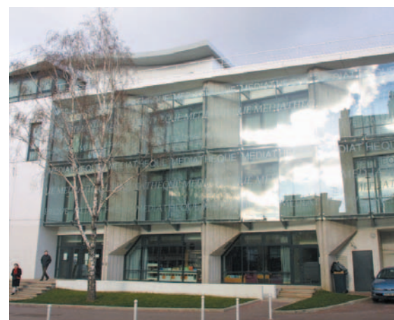
"Bientôt, vous flânerez dans les 2 500 m 2 de rayonnage proposant des ouvrages papier, numérique, etc."

D'ici peu, lorsque vous aurez décidé d'aller à la Médiathèque en famille, vous ne manquerez de vous arrêter au premier étage pour faire le tour des rayons