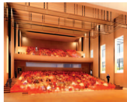
Une salle de spectacle sur mesure - Projet : Vue sur la salle de spectacle

Maintenant que la plupart des services municipaux ont emménagé au 4, rue Edmond Champeaud et que la Médiathèque est en voie d'achèvement, ce projet va pouvoir prendre forme. Cependant, il reste à l'entrée du bâti-