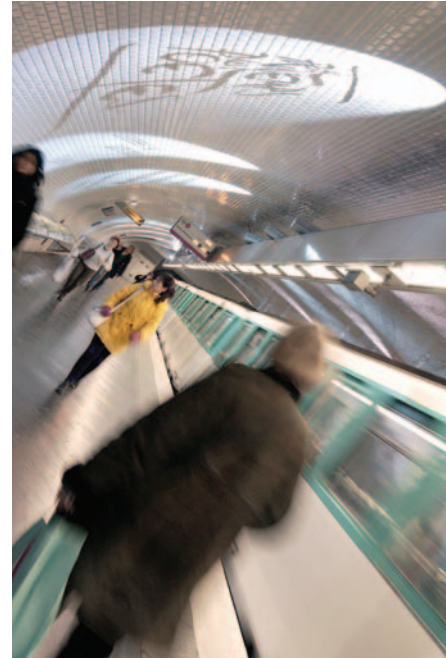
Suite à une nouvelle évaluation des travaux, la Station Mairie de Montrouge pourrait ouvrir en 2010

“Mairie de Montrouge” ne sera qu'un terminus provisoire puisque la ligne sera ultérieurement prolongée de “Verdun Sud”, située à Montrouge, jusqu'à Bagneux. Cette ligne permettra des correspondances avec les lignes de bus du sud des Hauts-de-Seine, mais aussi