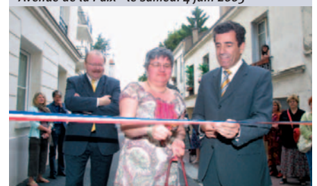
Avenue de la Paix - le samedi 4 juin 2005