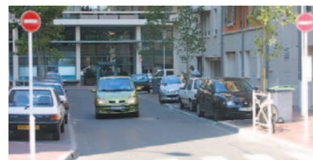
Les Allées de la Vallière sont désormais en sens unique !

Les carrefours à feux tricolores de la place du 8 mai et du carrefour Sembat - Marne - Verdier ont été mis aux normes et une traversée protégée créée. En juin, un ralentisseur a été créé au milieu de la rue Pascal. En octobre, ce sera le tour de la rue Sadi Carnot où deux passages piétons surélevés ont été posés en bout de rue et un ralentisseur installé au