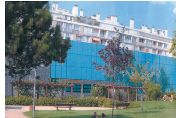
Des bureaux neufs et spacieux

Ce chantier reprendra courant septembre après que des travaux de désamiantage aient été nécessaires.