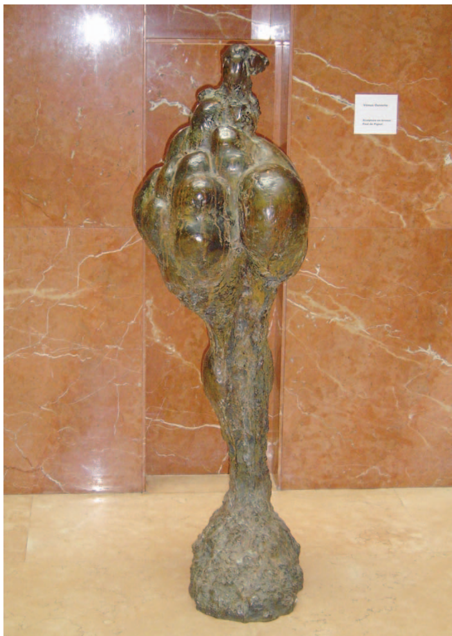
"Venus ouverte" de Paul de Pignol

Il y a 5 ans, à partir du Salon de Montrouge, a été créé le Salon