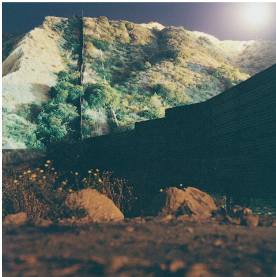
"Lumière inquisitrice" de Laetitia Tura

Pour s'inscrire à une visite, conférence ou pour toute autre information au 01 46 12 75 70