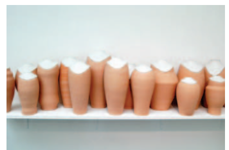
"Antiquité tardive" (détail), de Céline Cléron

Partant de ce constat, le Directeur artistique a imaginé pour vous un autre cheminement entre les œuvres. Il vous offre un voyage extraordinaire. Ainsi, au lieu d'exposer des œuvres significatives par genre (peinture, collage, etc.), c'est un parcours de l'Univers à l'homme, du général au particulier, de l'environnement à l'esprit que vous propose le Salon.