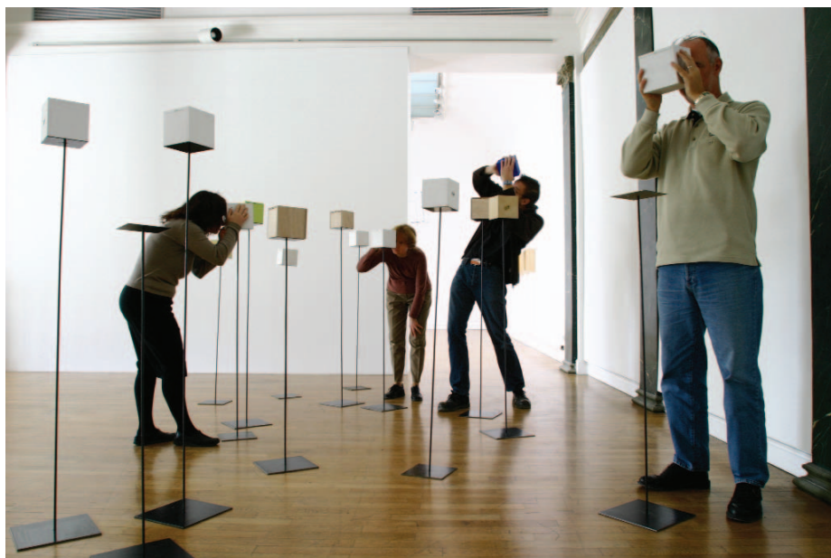
"L'intérieur est l'intérieur de l'intérieur" de Marcela Gomez