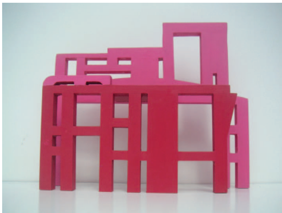
Œuvre de Feirrer

vocation première d'ouverture et d'échange, le concept de "membres associés" permettra à la Pologne, la Slovaquie, la Lituanie et la Suède d'être représentés par 5 jeunes créateurs sans pour autant accueillir, faute de temps, le SEJC sur leurs territoires. Le prix européen des jeunes créateurs, décerné par l'ensemble des commissaires artistiques des pays européens, récompense les travaux les plus remarquables de l'année.