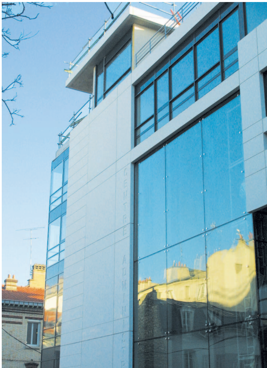
Façade du nouveau centre administratif

Hôtel d'activité, rue François Ory. Les différents corps de métiers se sont attelés à la conception intérieure des sept étages prévus.