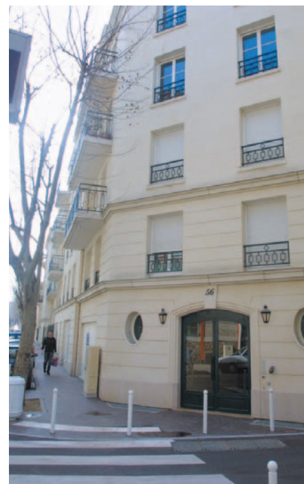
Réfection des trottoirs rue Maurice Arnoux

Afin de mieux signaler la mise en double sens de la rue Louis Lejeune, du mobilier urbain a été posé côté impair. Les trottoirs au droit du passage piéton à l'angle des rues Delerue et Edgar Quinet ont été réaménagés afin de faciliter la circulation des personnes handicapées. A l'angle de cette dernière et de la rue Rabelais, les places de