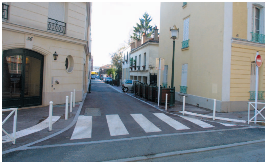
Avenue de la Paix : voirie refaite

stationnement ont également été refaites. L'effondrement au droit de l'entrée de l'école Renaudel rue Jules Chéret a été réparé. L'arrêt de bus situé au 139, avenue Pierre Brossolette qui gênait les riverains a été déplacé et réaménagé.