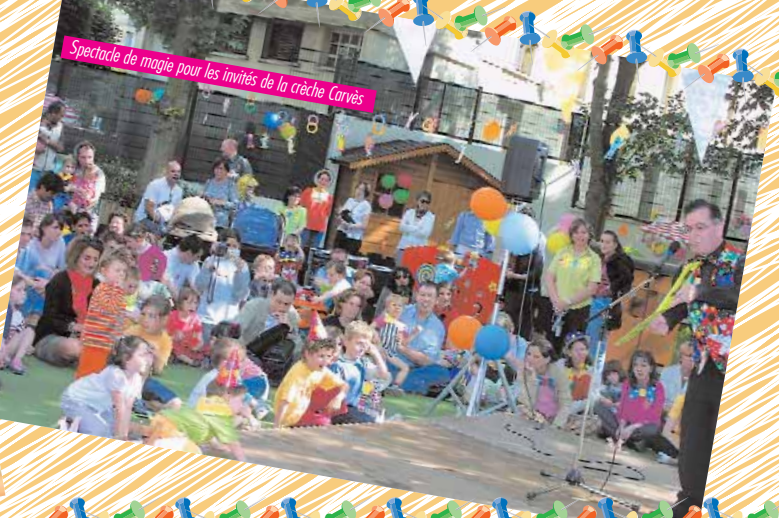
Spectacle de magie pour les invités de la crèche Corvès