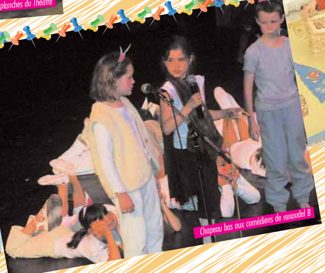
Chapeau bas aux comédiens de renaudel B