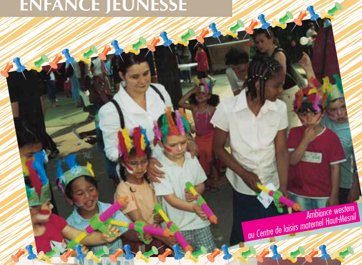
Ambiance western au Centre de loisirs maternel Haut-Mesnil