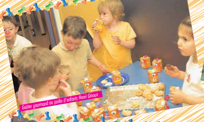
Goûter gourmand au jardin d'enfants Henri Ginoux