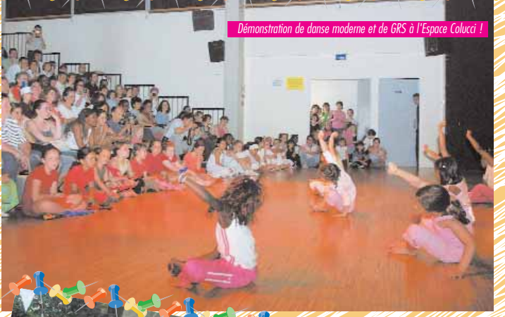
Démonstration de danse moderne et de GRS à l'Espace Colucci !