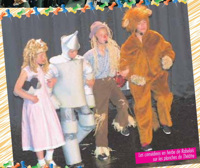
Les comédiens en herbe de Rabelais sur les planches du Théâtre