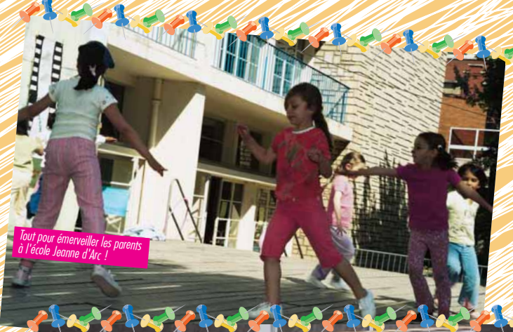
Tout pour émerveiller les parents à l'école Jeanne d'Arc !