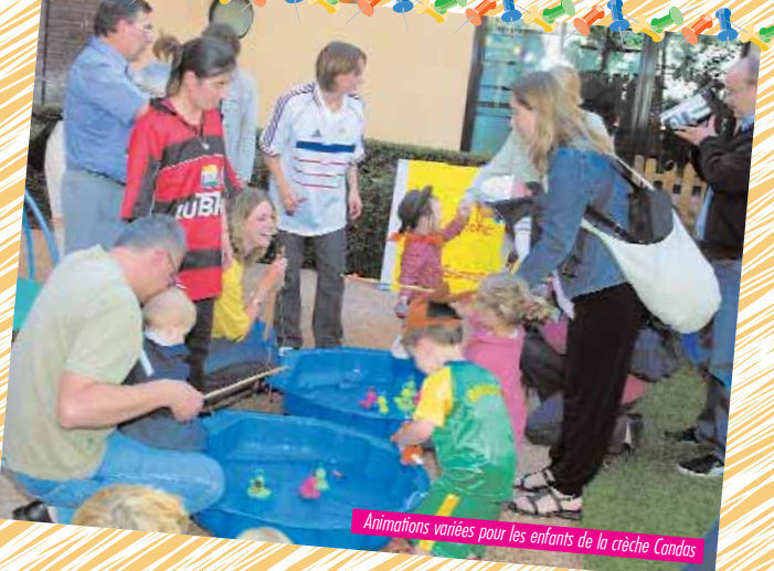
Animations variées pour les enfants de la crèche Candos