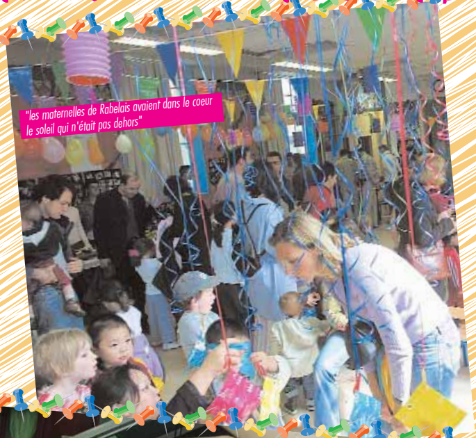
"les maternelles de Rabelais avaient dans le cœur le soleil qui n'était pas dehors"