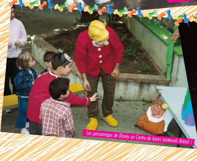
Les personnages de Disney au Centre de loisirs maternels Briand !