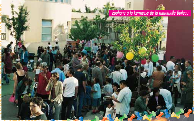
Euphorie à la kermesse de la maternelle Boileau