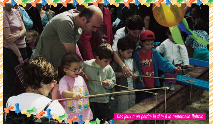
Des jeux a en perdre la tête à la maternelle Buffalo