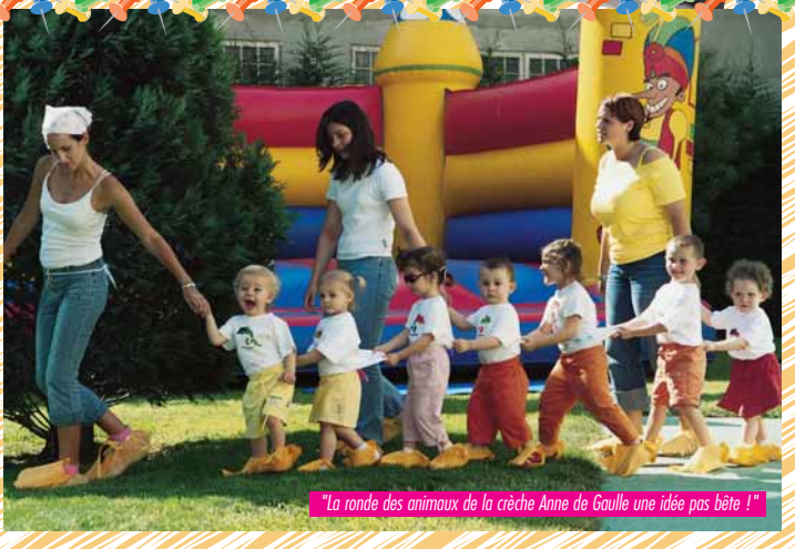
"La ronde des animaux de la crèche Anne de Gaulle une idée pas bête !"