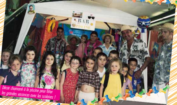
Décor chamarré à la piscine pour fêter les grandes vacances avec les scolaires !