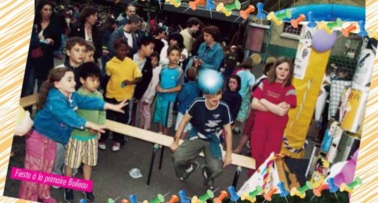
Fiesta à la primaire Boileau