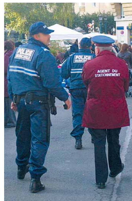
Nouvel uniforme pour les ASVP.

La verbalisation est la “moins mauvaise” des méthodes pour permettre une meilleure rotation des véhicules. Ce qui explique pourquoi le stationnement en zone commerçante est limité à 1 ou 2h. Contrairement aux idées reçues, la Ville installe des horodateurs à la demande des riverains qui ne peuvent plus se garer à cause des voitures-ventouses et non pour remplir les caisses de la Ville. “Chaque appareil coûte 10 000 € !”. ■