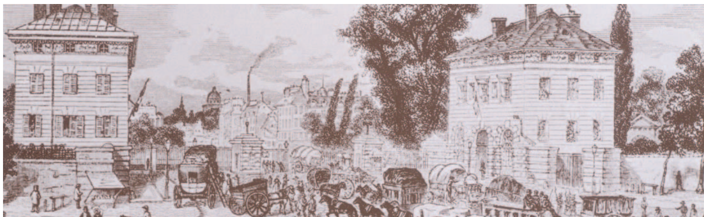
Les pavillons Ledoux à la barrière d'Enfer - vers 1850.