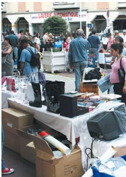
Vide-grenier rue Théophile Gautier

Chineurs, à votre agenda pour les prochains vide-greniers :