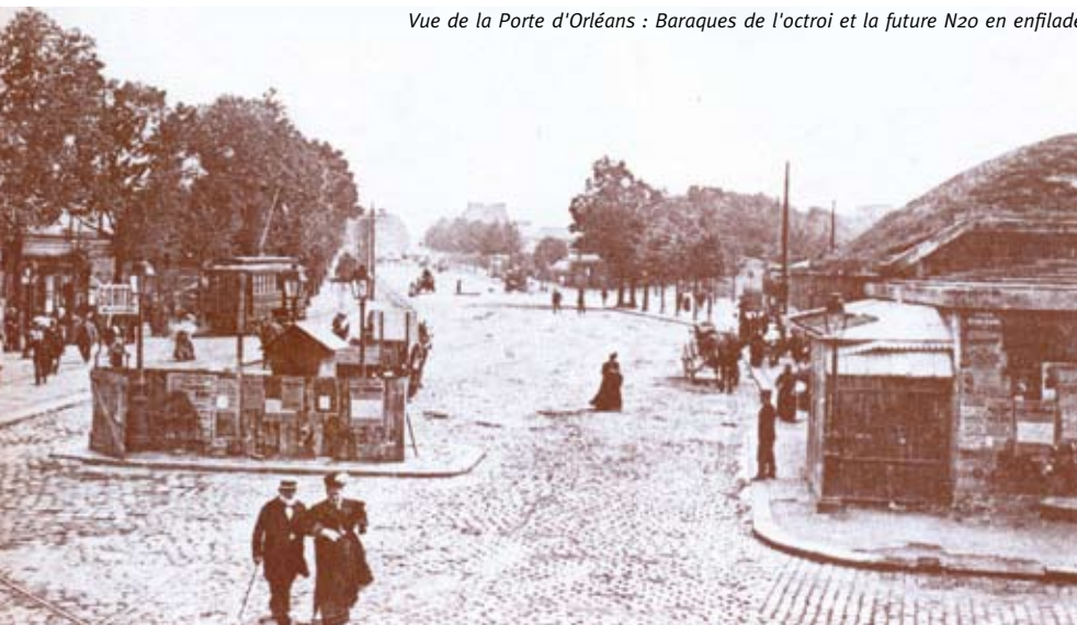
Vue de la Porte d'Orléans : Baraques de l'octroi et la future Nzo en enfilade.

Patrick Vauzelle, société historique et archéologique du Grand Montrouge