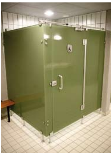
Les douches pour handicapés à la piscine

Pour suivre et coordonner l'ensemble de ces actions, l' élu et le référent handicap sont à l'écoute des familles et des associations au 01 46 12 74 18.