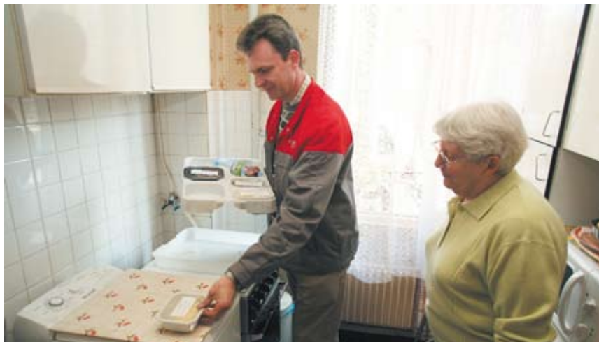
Livraison de repas à domicile

- Service de Soins Infirmiers à Domicile : totalement financé par l'assurance-maladie, ce service développé par la Ville répond aux besoins en soins infirmiers et d'hygiène des Montrougiens de plus de 60 ans, ou sur dérogation pour