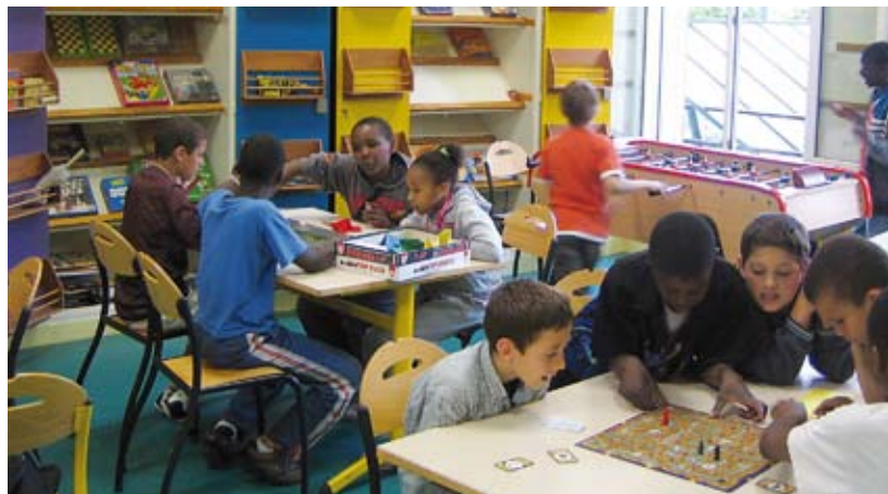
Club 8-13 ans