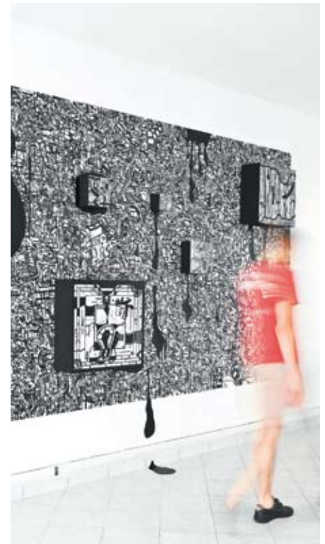
Sans titre : Pierluigi Lanzilotta, Italie Senza titolo 2007 Motifs imprimés sur pvc 300x200 cm.

de l'artiste dans l'art contemporain européen ». Les huit villes qui forment le réseau : L'Hospitalet en Espagne, Gênes en Italie, Klaipeda en Lituanie, Salzburg en Autriche et Amarante au Portugal, et les deux nouvelles villes de cette 8 e édition : Pécs en Hongrie et Bratislava en Slovaquie. La Pologne est cette année pays invité à Montrouge en vue d'un partenariat avec la ville de Cracovie pour 2011.