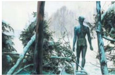
Proschek : Markus Proschek, Autriche Amazon-LKH Salzburg Oil on canvas 150 x 200 cm, 2006

Une fois sélectionnés, ces nouveaux talents peuvent facilement se déplacer dans les villes partenaires pour présenter leur travail grâce à un système de résidences d'artistes mis en place par les municipalités.