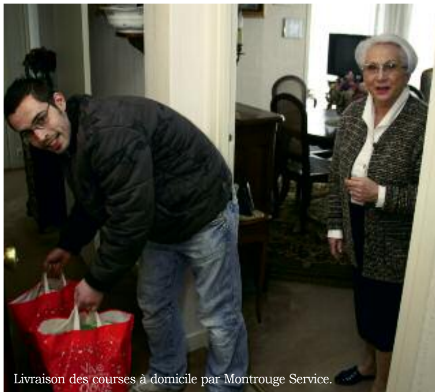
Livraison des courses à domicile par Montrouge Service.

Le Centre d'Action Sociale et le Centre Municipal de Santé se tiennent à la disposition des Montrougiens pour répondre à leurs interrogations.