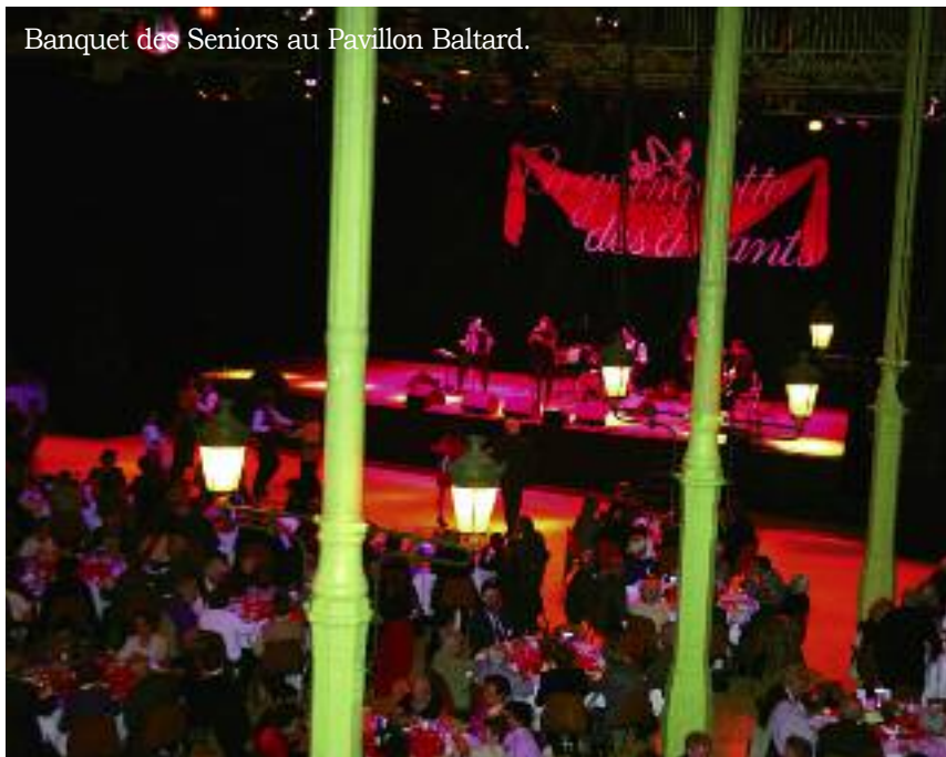
Banquet des Seniors au Pavillon Baltard.