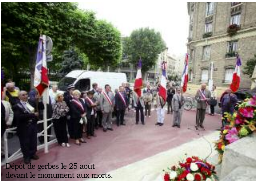
Dépôt de gerbes le 25 août devant le monument aux morts.

Pour plus d'informations complémentaires, contacter le Centre d'Action Sociale de Montrouge au 01 46 12 74 10 ou l'Office National des Anciens Combattants et Victimes de Guerre (ONAC) au 01 42 04 48 97.