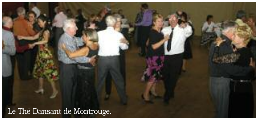
Le Thé Dansant de Montrouge.