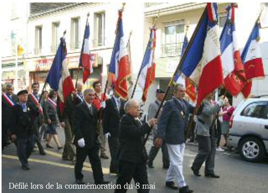
Défilé lors de la commémoration du 8 mai

Fédération Nationale des Anciens Combattants d'Algérie (Maroc et Tunisie) Tél. 01 46 55 74 38.