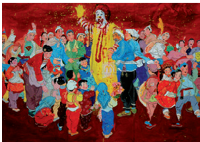
La joie 2007, acrylique sur toile, 200 x 280 cm