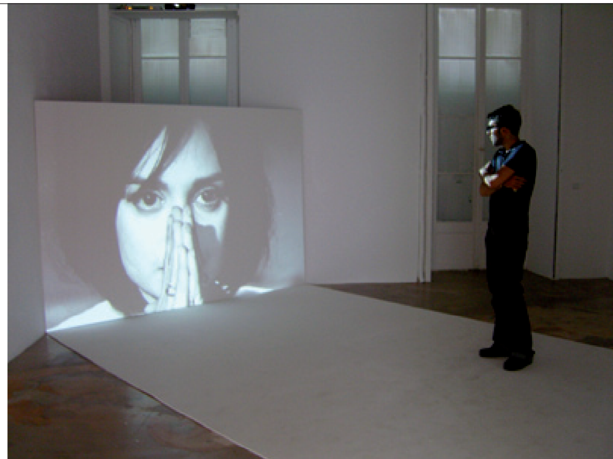
La Passerelle 2008, vidéo, noir et blanc, double projection face à face, dimensions variables, 4 minutes en boucle