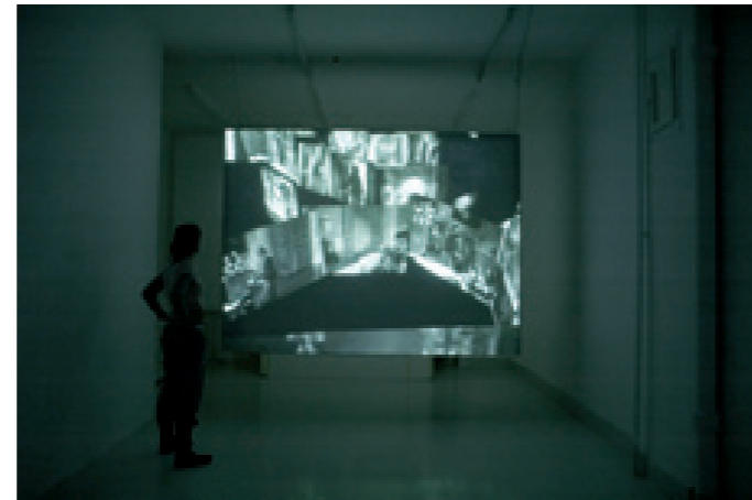
Manderley 2007, vidéo, noir et blanc, dimensions variables, 20 minutes en boucle