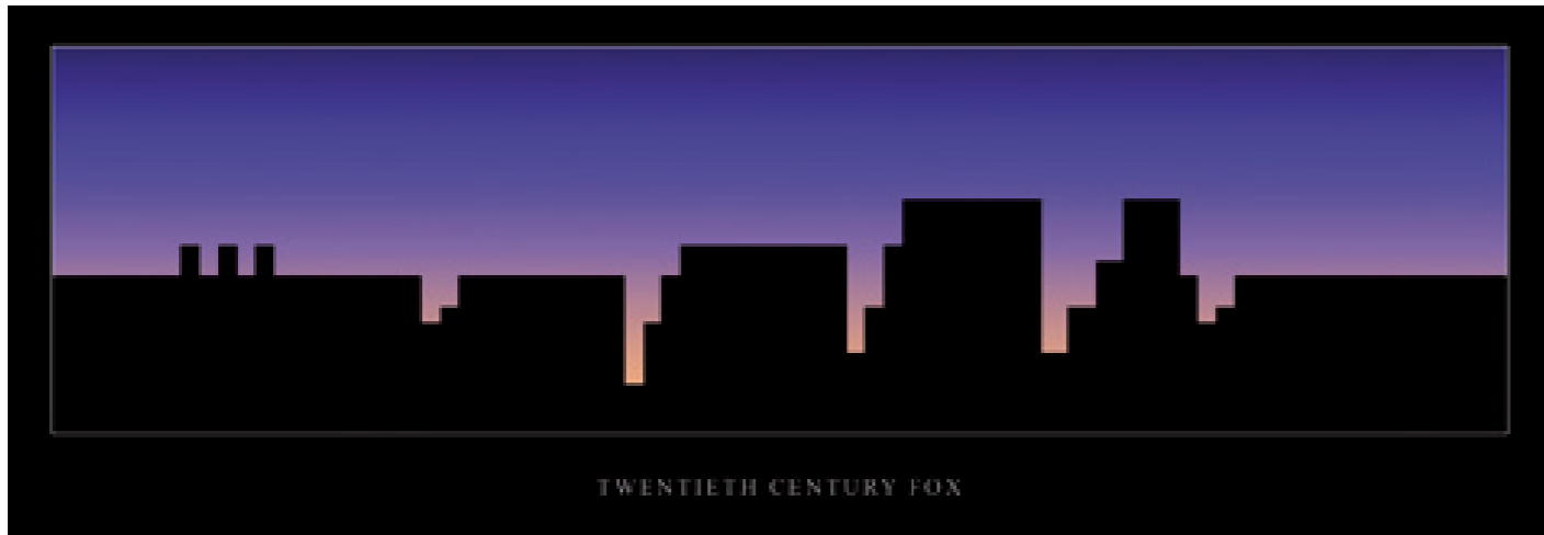
Translation #1 - Signature Tunes 2008, 6 impressions numériques encadrées, 95 x 33 cm chaque