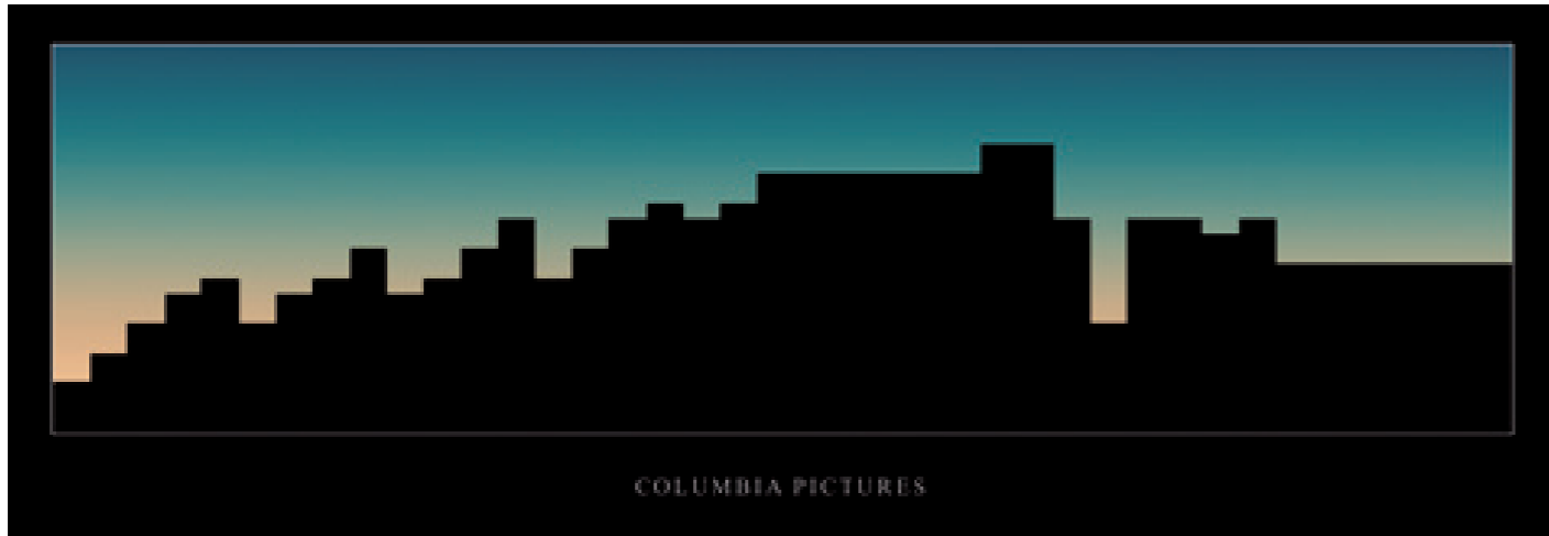
Translation #1 - Signature Tunes 2008, 6 impressions numériques encadrées, 95 x 33 cm chaque