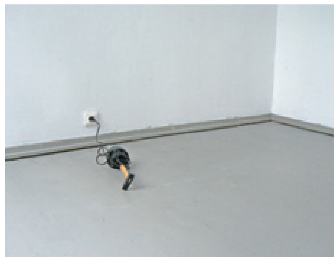
Chorégraphie 2008, marteau et moteur de boule à facettes, 12 x 40 cm