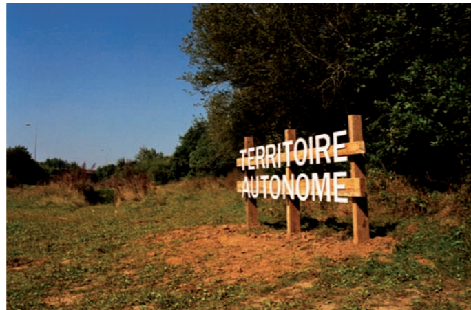
Territoire Autonome 2008, installation en situ + 5 tirages Lambda, 75 x 48 cm