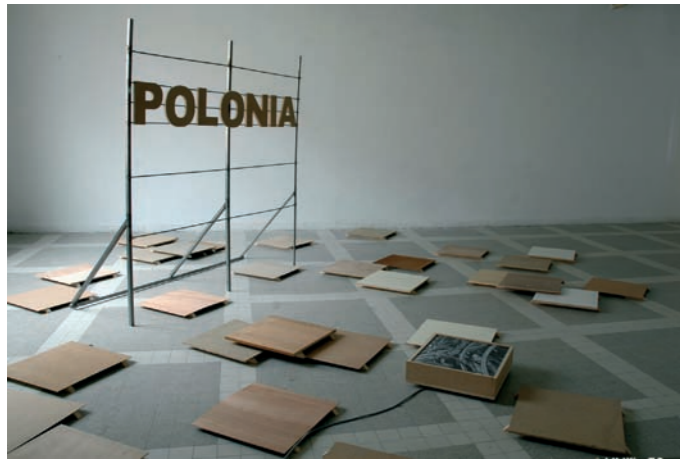
Polonia 2006, enseigne 3 x 2 m, 45 planches de bois brut sur tasseaux 50 x 50 cm, table lumineuse