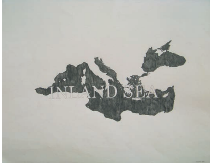
Inland Sea 2009, crayon sur papier, 50 x 65 cm