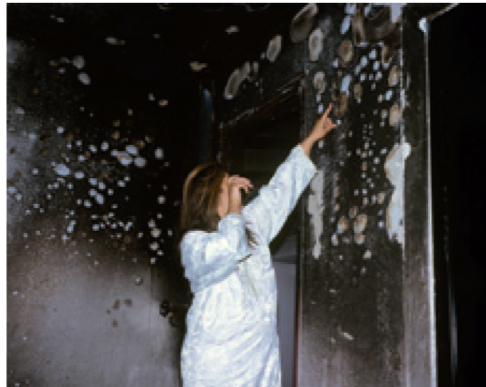
Sans titre 5 (de la série Index ) 2007, tirages lambdas, 80 x 100 cm et 40 x 50 cm