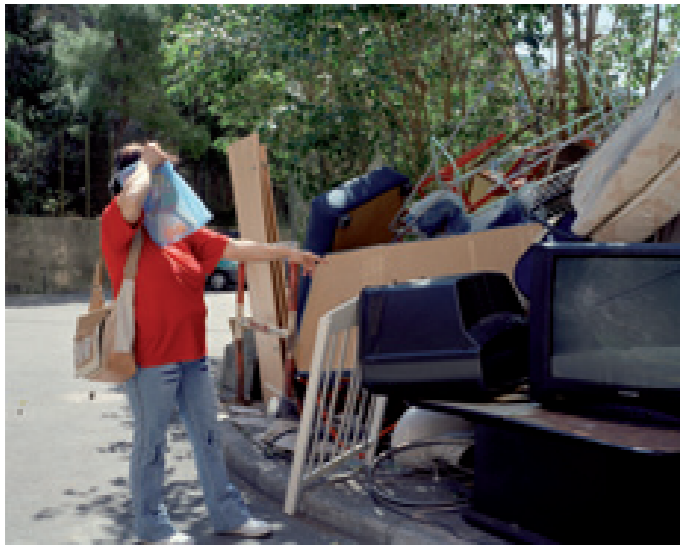
Sans titre 2 (de la série Index ) 2007, tirages lambdas, 80 x 100 cm et 40 x 50 cm