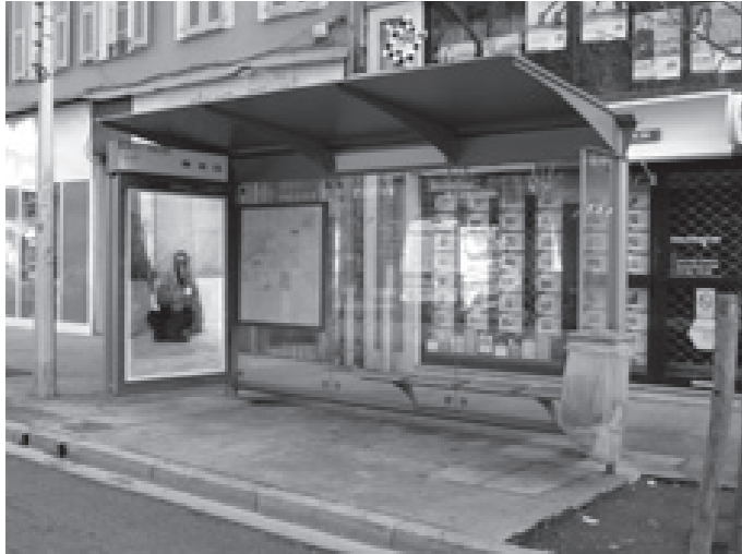
Accrochage public de 4€20 2008, affiche pour supports publicitaires, dimensions variables