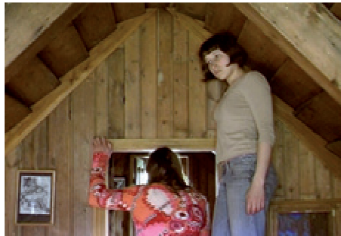
Skogard 2007, vidéo réalisée avec Lise Lecocq