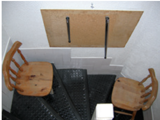
Escaliers 2006, meubles divers