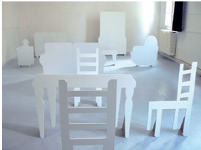
Silhouettes 2008, médium, peinture à carrosserie, dimensions variables