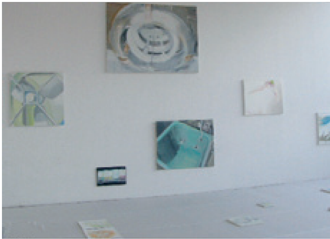
Suspended Time 2008, vue d'exposition, Université National des Beaux-Arts de Tokyo, Japon