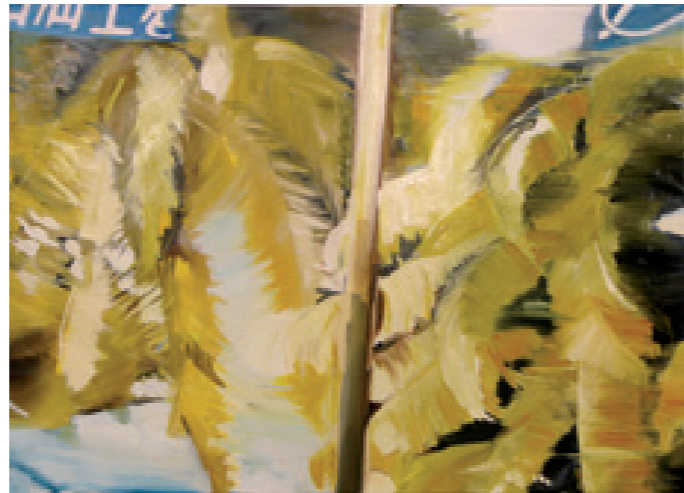
Typhoon 2007, huile sur toile, 180 x 131 cm