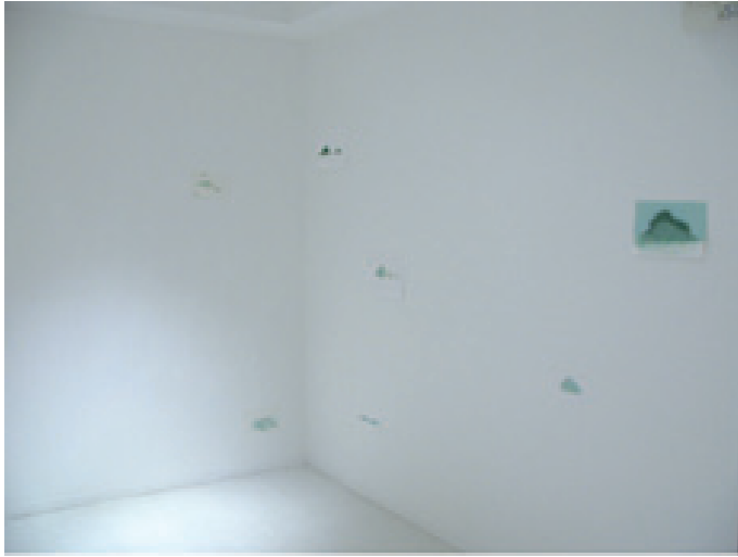
Inland Sea 2008, vue d'exposition, Galerie Open Door, Tokyo