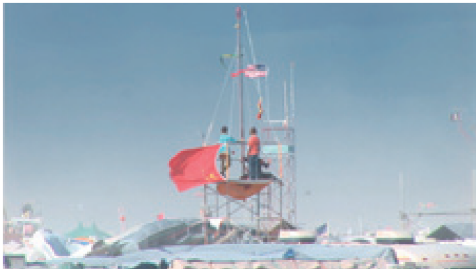
Wild west, Nevada 2009, vidéo