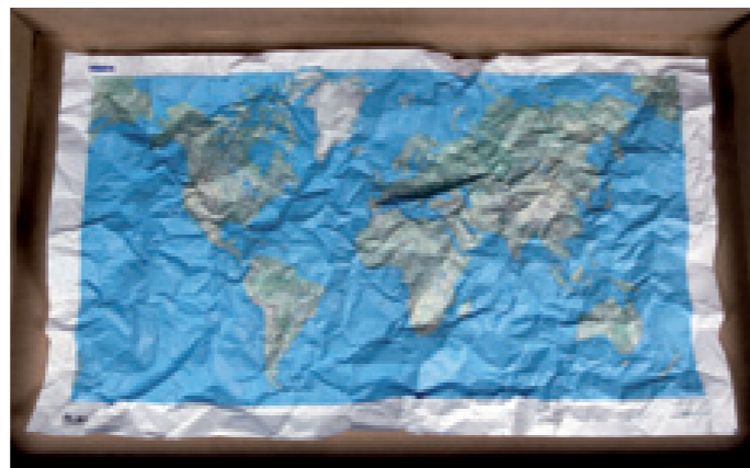
Plan relief 2008, carte froissée, vitrine