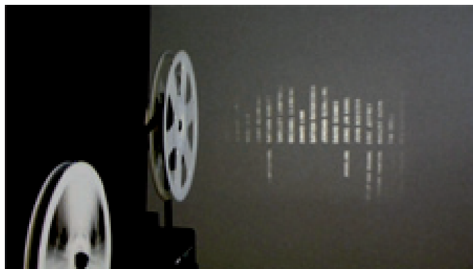
Travelling 2008, film Super 8 en boucle