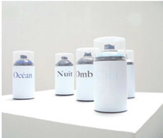
Fabrique 2006, bombes de peintures aérosols, dimensions variables