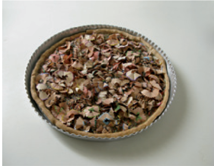
Tarte crayon 2008, épluchures crayon, pâte brisée cuits au four, volume 8 parts