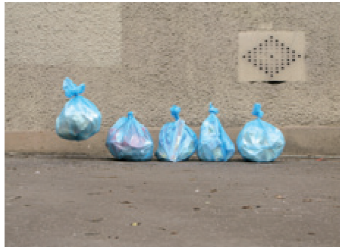
Lévitacion poubelle 2008, ballon hélium, sacs poubelles, photographie témoin d'éléments placés en milieu urbain